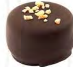
70160 ANGERS ganache de naranja y naranja confitada (14,5gr)