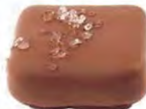
70060 NANTES caramelo con sal marina (13,5gr)