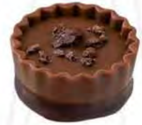
76020 TONKA ganache de camarú (13gr)