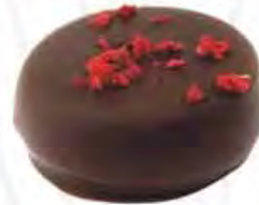
70240 CHLOE crema de frambuesa (12,5gr)