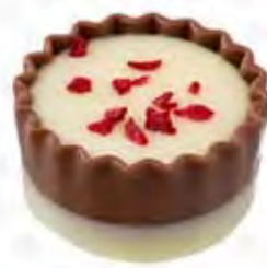
72050 PROMESA crema de frambuesa (13gr)