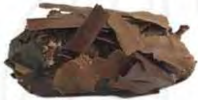
DF0100028 TRUFA NEGRO mousse de chocolate negro (12,5gr)