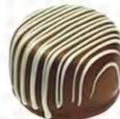
70040 NOUGAT CRISP crema de nougat con crujiente (16gr)