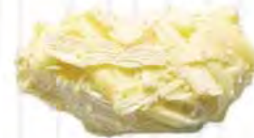
DF0100030 TRUFA BLANCO mousse de chocolate blanco (12,5gr)