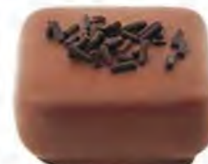
70090 AUBE mousse de chocolate (13,5gr)