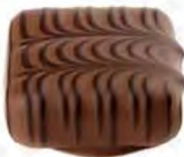
70080 MONALISA crema de avellana con nuez y canela (13,5gr)