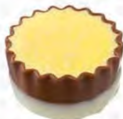
70280 ORLEANS crema catalana (14gr)