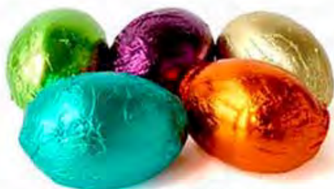
102-01566-999 MINI HUEVOS

surtido de chocolate con leche, chocolate negro y chocolate blanco (7gr)