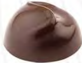
60090 VOLTAIRE nougat con nuez moscada (9,5gr)