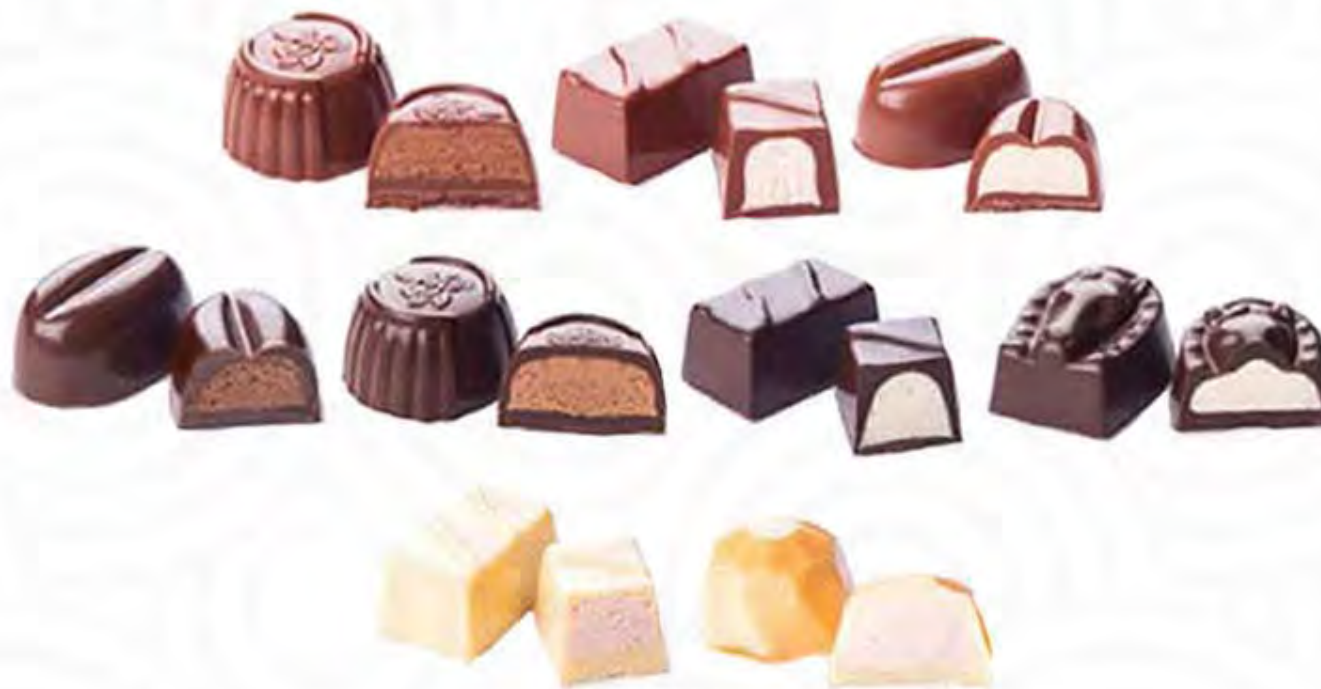
7003003 SIN AZUCAR

chocolate negro con 7 variedades de licor (14gr)