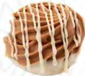
70030 FLORIS gianduja (15gr)