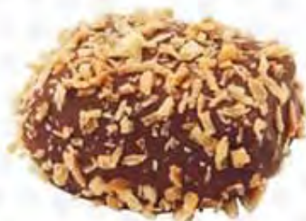
70230 LOVAINA crema de nougat con coco tostado (16gr)