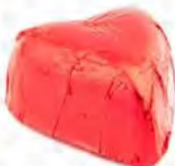
62110 CORAZON ROJO crema de nougat (10,5gr)