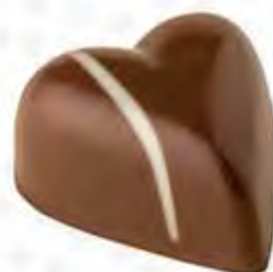
60290 VALENTINE mermelada de albaricoque con toque de menta (10,5gr)