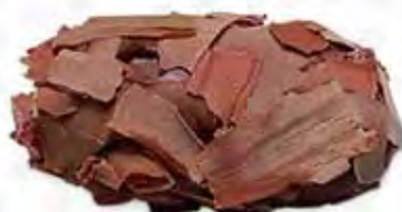
DF0100029 TRUFA LECHE mousse de chocolate con leche (12,5gr)