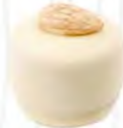
70140 JUANA DE ARCO crema de almendra (15,5gr)