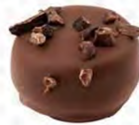
70020 RIO DE JANEIRO ganache crujiente con sirope de arce y corteza de cacao (12gr)